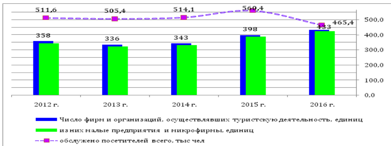
Рисунок 1. Число организаций, осуществлявших туристическую деятельность и лица, которым были оказаны услуги (2012–2016 гг.) 4

В 2016 г. число действующих туристических фирм составило 433 единицы, по сравнению с 2012 г. на 75 фирм больше. Число лиц, которым были оказаны туристические услуги в 2012 г., составило 511,6 тысяч человек, а в 2016 г. – 465,4 тысячи.