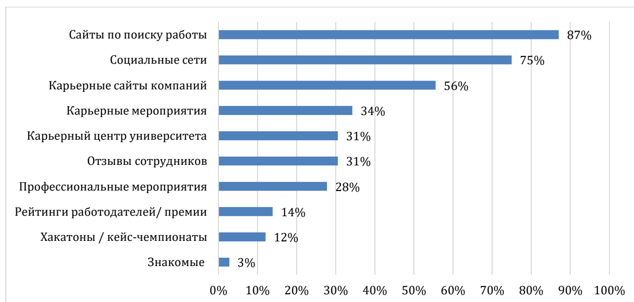
Рисунок 3. Источники информации о потенциальных работодателях среди студентов (составлено авторами)

На рисунке 3 представлены результаты опроса, показывающие популярность различных источников информации о потенциальных работодателях среди студентов. Полученные результаты позволяют оценить значимость различных каналов и определить, какие из них оказывают наибольшее влияние на восприятие бренда работодателя среди студентов и выпускников.