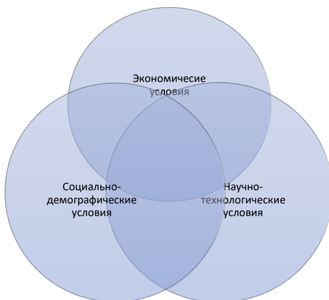
Рисунок 1. Структура инновационного климата в рамках универсального подхода

Данный подход можно использовать в качестве базового, при этом его практическое применение ограничено в силу того, что он не позволяет учитывать специфические особенности изучаемого объекта, определяемые пространственно-географическим положением, природно-климатическими особенностями, культурными и национальными традициями и другими факторами. Поэтому предлагаем придерживаться специального подхода, в рамках которого структура элементов включает более разнообразный набор условий, дополненных, например, инфраструктурными и природными (рис. 2).